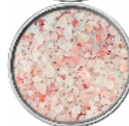
Sale Rosa Grosso