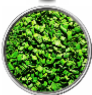
Erba Cipollina - Liofilizzata