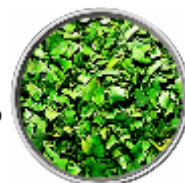
Basilico - Liofilizzato