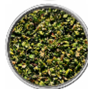
Origano - Essiccato