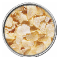
Aglio a Fette