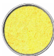
Mago Panata - Panatura Senza Pangrattato